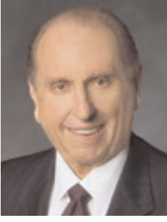
Başkan Thomas S. Monson