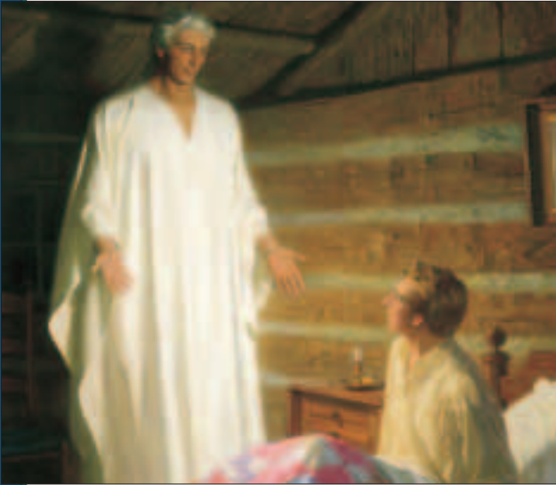
Joseph Smith'in İlk Vizyonundan üç yıl sonra Tanrı, İsa Mesih'in sevindirici haberinin iade edilmesiyle ilgili olarak Joseph'a talimat vermesi için, melek Moroni'yi gönderdi.

Joseph Tanrı'ya gördüğünü inkar etmeyi reddettiği sürece zulüm devam etti. 21 Eylül 1823 günü yatağına yattıktan sonra, Joseph Rab'bın huzurundaki yerini öğrenmek üzere dua etti. Melek Moroni ona göründü.