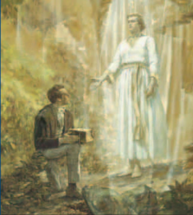
Moroni dört yıl süresince, yılda bir defa gelip genç peygambere detaylı talimatlar verdi. Bu dört yıldan sonra, Joseph levhaları aldı ve Mormon Kitabı'nı tercüme etmeye başladı.

Hemen yataktan kalktım ve her zaman yaptığım gibi, günlük gerekli işlere başladım; fakat diğer zamanlarda olduğu gibi çalışmaya yeltendiğimde, gücümün hiçbir suretle çalışamayacağım kadar tükendiğini farkettim.