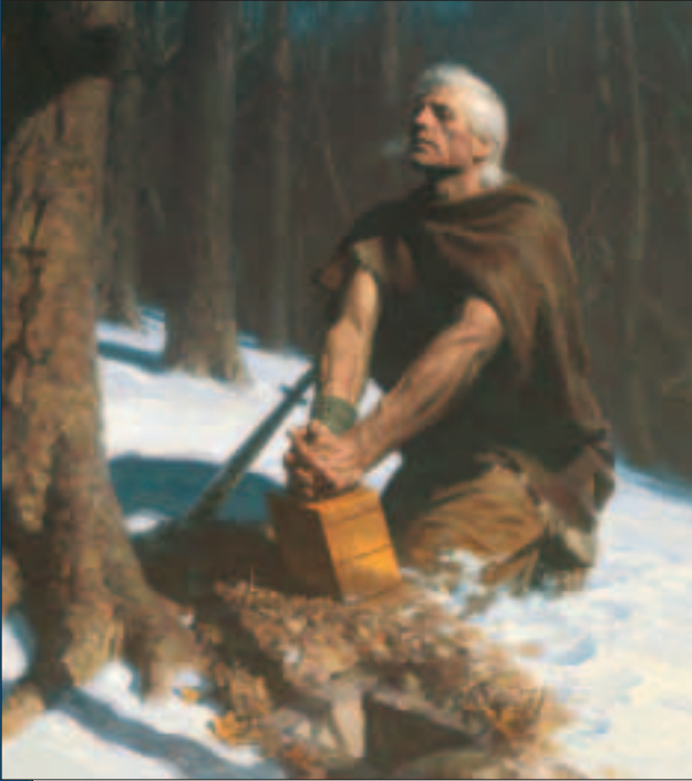
M. S. 421 yılında, peygamber Moroni kendi insanlarının mukaddes kayıtlarını Cumorah Dağı'na gömdü. Daha sonra, dirilmiş bir kişi olarak geri döndüğünde, Joseph Smith'e Kurtarıcı'nın Amerika kıtasının eski sahiplerine bıraktığı şekliyle sevindirici haberin tamamını içeren eski kayıttan bahsetti. O kayıt, Mormon Kitabı'dır.

Bunun yanı sıra, levhalarla birlikte gümüş kemerler içinde iki tane taşın da saklı olduğunu söyledi. Bir göğüs zırhına bağlanmış olan bu taşlar, Umim ile Tumim'i teşkil etmekteydi. Bu taşların mülkiyetinin ve kullanımının antik veya eski çağlardaki 'görenlerin' ne olduğunu anlattığını söyledi. Ve Tanrı onları kitabın tercüme edilmesi amacıyla hazırlamıştı.