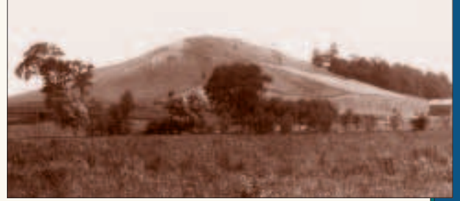
Cumoralı Dağı, New York Palmyra'daki Smith çiftliğinin yaklaşık olarak üç mil güneydoğusundaydı. Joseph'in zamanında, kuzey ucu çimenle, güney kesimi ise seyrek ağaçlarla ve ormanlarla kaplıydı. Levhalar batı kesiminde tepeye çok yakın bir yerde gömülüüydü. Fotoğraf: Ağustos 1907

Bu sırada, benim zihnimde oluşan etkiler o kadar derindi ki, uykum kaçtı ve görüp duyduğum şeylerin hayretiyle şaşkına döndüm. Ancak, aynı elçi tekrar gelip yatağımın yanında durduğunda, daha önce anlattığı şeylerin aynısını uzun uzadıya anlattığını ya da tekrar ettiğini duyduğumda çok şaşırırdım. Bana ayrıca bir uyarıda da bulundu: Şeytan'ın bu levhaları