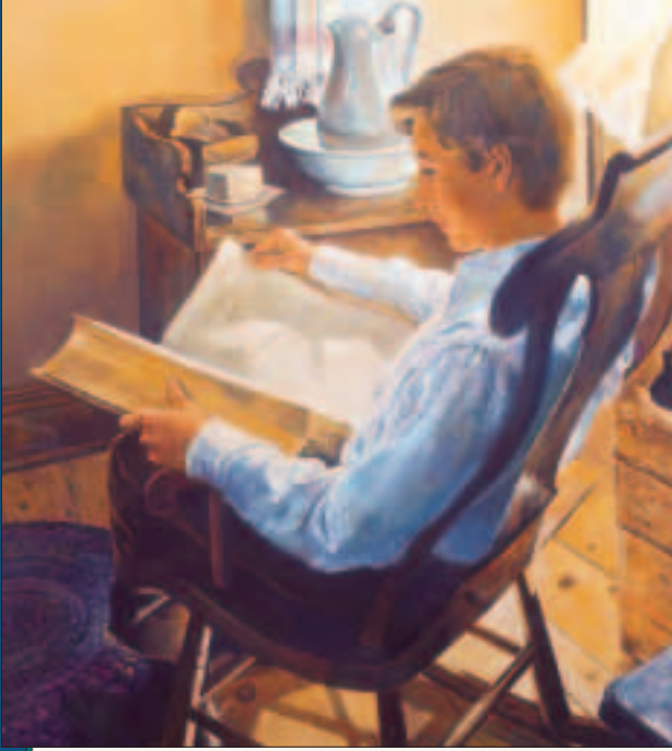
Joseph hangi kiliseye katılacağını düşünürken, Kutsal Kitabın rehberliğini araştırdı. Orada, «Tanrı'ya sor» sözlerini okudu.

O günden sonra Joseph, son zamanlarda, İsa Mesih'in Son Zaman Azizler Kilisesi'ni oluşturmak ve yeryüzünde Tanrı'nın krallığını inşa etmek üzere çalışarak Tanrı'nın hizmetinde yer aldı. Kilise'nin imanlı üyeleri, İsa Mesih'in dünyanın Kurtarıcısı ve Kefaretle Ödeyeni olduğuna şahitlik etmektedirler. Bugün İsa, yeryüzündeki bir peygambere gönderdiği vahiyler yoluyla Kilisesini yönetmektedir. Joseph Smith böyle bir peygamberdi. Joseph hayatı boyunca birçok şeyi