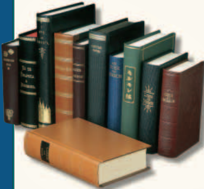
Mormon Kitabı, ilk olarak 1830’da basılmış olup, halihazırda dünya genelinde 80’den fazla dilde yayımlanmaktadır.

Joseph Smith’in hikayesi ile ilgili daha detaylı bir anlatım için, bkz. Değeri Yüksek İnci’de veya Kilise Tarihi’nde yer alan Joseph Smith – Tarihçe, 1:2–79.