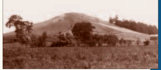
Cumoralı Dağı, New York Palmyra'daki Smith çiftliğinin yaklaşık olarak üç mil güneydoğusundaydı. Joseph'in zamanında, kuzey ucu çimenle, güney kesimi ise seyrek ağaçlarla ve ormanlarla kaplıydı. Levhalar batı kesiminde tepeye çok yakın bir yerde gömülüüydü. Fotoğraf: Ağustos 1907

Bu sırada, benim zihnimde oluşan etkiler o kadar derindi ki, uykum kaçtı ve görüp duyduğum şeylerin hayretiyle şaşkına döndüm. Ancak, aynı elçi tekrar gelip yatağımın yanında durduğunda, daha önce anlattığı şeylerin aynısını uzun uzadıya anlattığını ya da tekrar ettiğini duyduğumda çok şaşır-dım. Bana ayrıca bir uyarıda da bulundu: Şeytan'ın bu levhaları